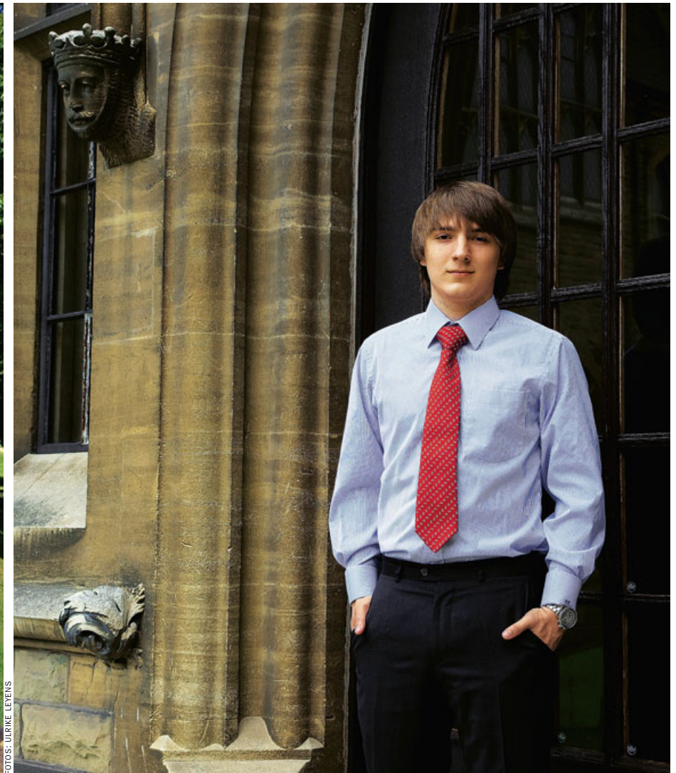
Ziel ist das globale Schuldiplom, das Weltabitur

suchen, für zwei Jahre oder länger. Viele von ihnen entscheiden sich für einen britischen Schulabschluss, weil sie damit schon nach acht Jahren Gymnasium studieren können – ihre deutschen Mitschüler müssen in vielen Bundesländern derzeit noch neun Jahre bis zum Abitur lernen.